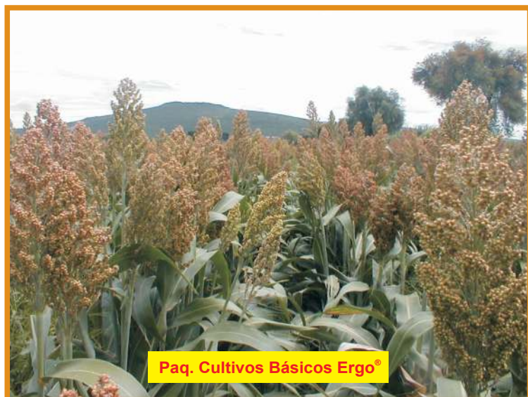
Paq. Cultivos Básicos Ergo®